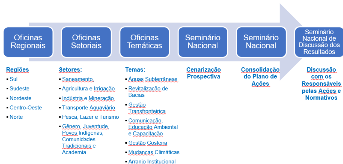
Figura 1 – Esquema do Processo Participativo de Construção do PNRH 2022-2040

A Figura 1 apresenta um esquema do processo participativo para a discussão e construção do PNRH 2022-2040.